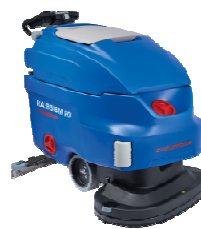
Ilustración con equipamiento opcional