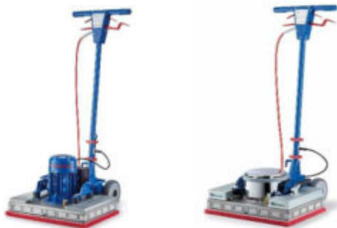
Ilustración con equipamiento opcional