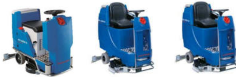
Ilustración con equipamiento opcional