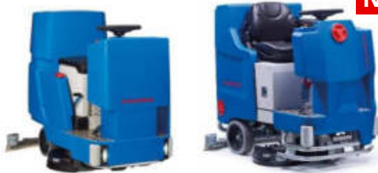
Ilustración con equipamiento opcional