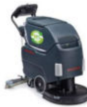
Ilustración con equipamiento opcional