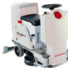
Ilustración con equipamiento opcional