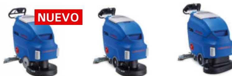
Ilustración con equipamiento opcional