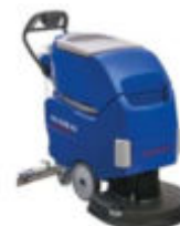
Ilustración con equipamiento opcional