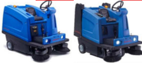
Ilustración puede contener equipamiento opcional