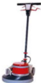
Ilustración con equipamiento opcional