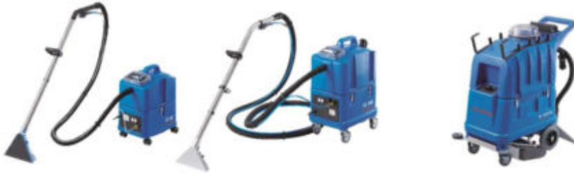
ilustración con equipamiento opcional