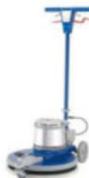
Ilustración con equipamiento opcional