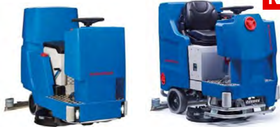
Ilustración con equipamiento opcional