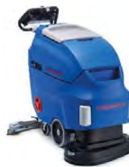
Ilustración con equipamiento opcional