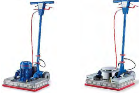
Ilustración con equipamiento opcional