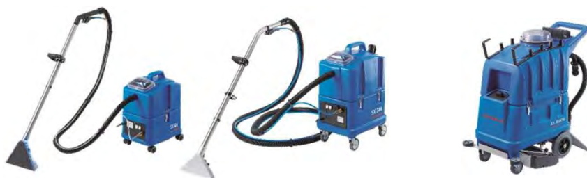
Ilustración con equipamiento opcional