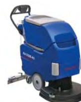
Ilustración con equipamiento opcional