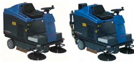
Ilustración con equipamiento opcional