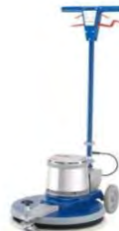
Ilustración con equipamiento opcional