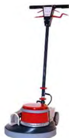
Ilustración con equipamiento opcional