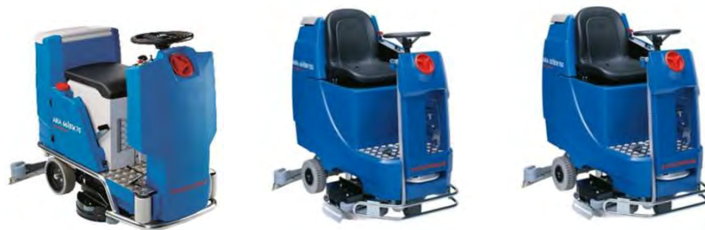
Ilustración con equipamiento opcional